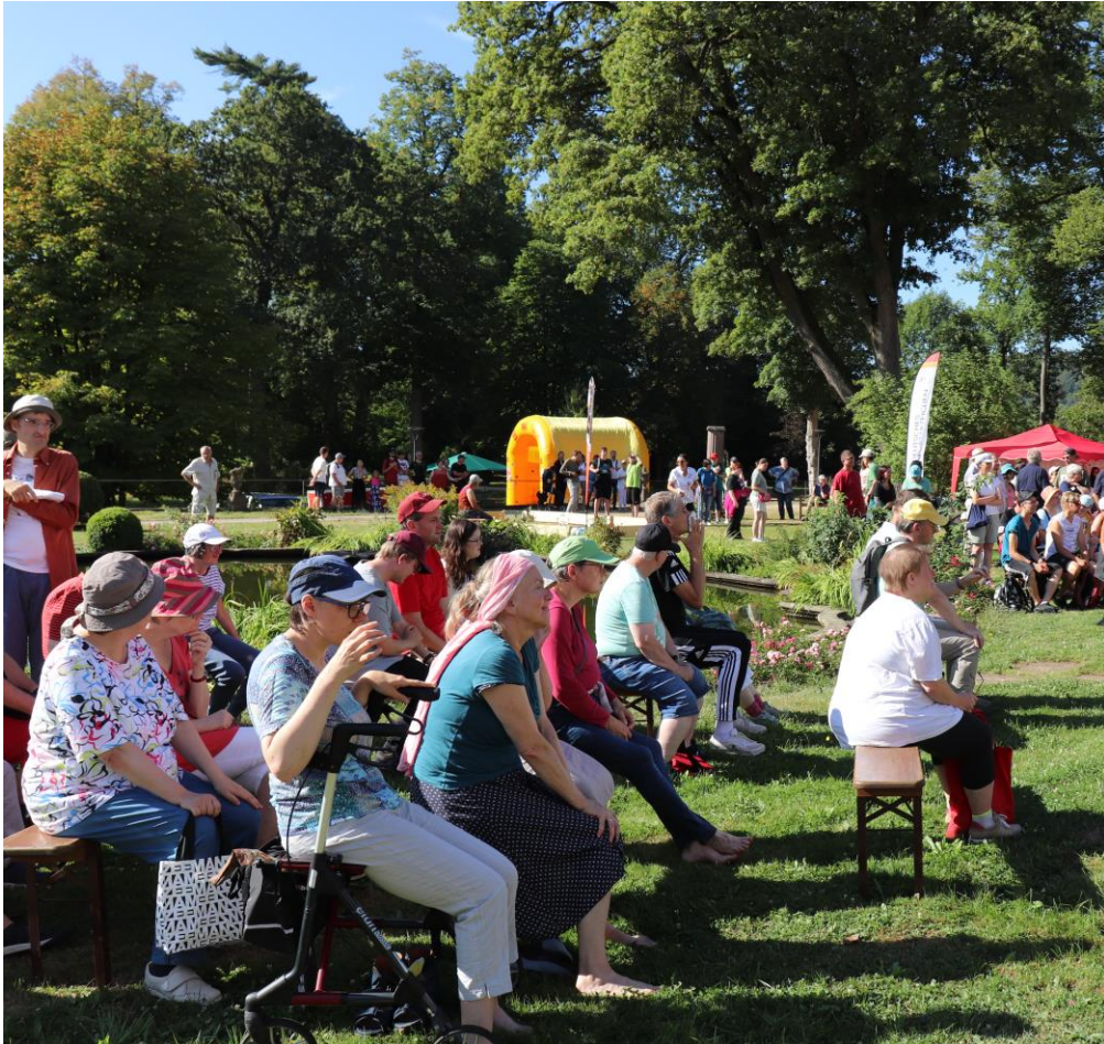
Sportfestival für alle/ EWoS/ Sport im Park Isb h